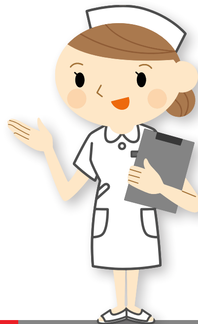
Verpleegkundige / Huisartsassistent